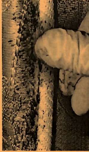
Manchas de sangre, chinches y exoesqueleto de reparto se encuentre en la costura de colchón

Cuando visite hoteles inspeccione la habitación en busca de signos de chinches de la cama antes de desempacar el equipaje.